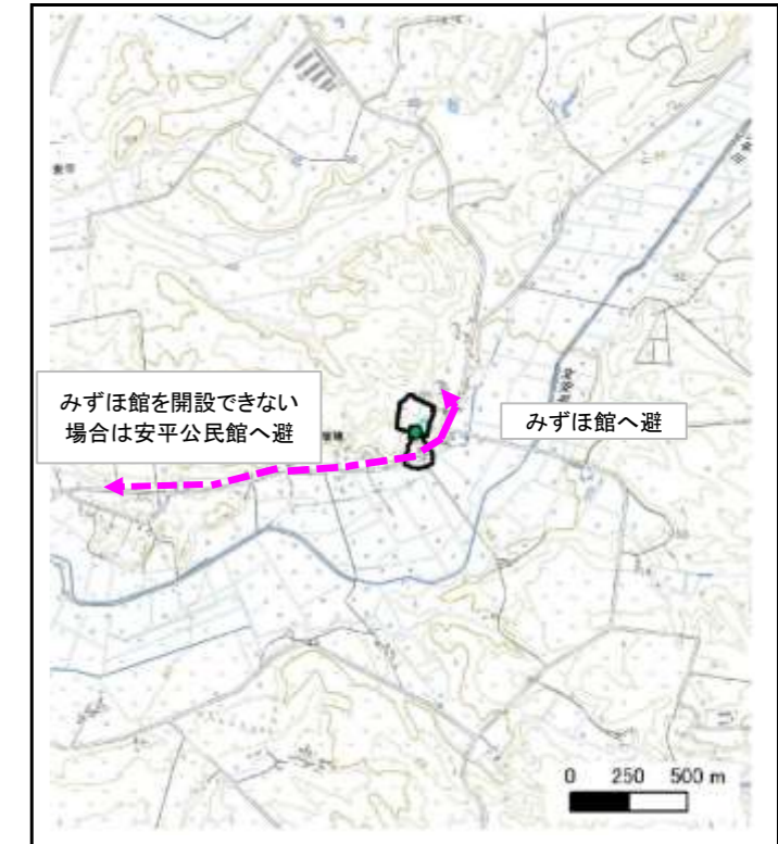
位置図 (図の上位が北を示す)