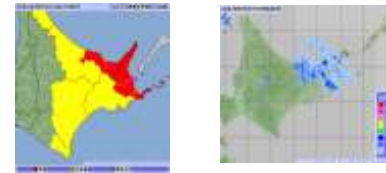
～雨の強さと災害の発生状況～