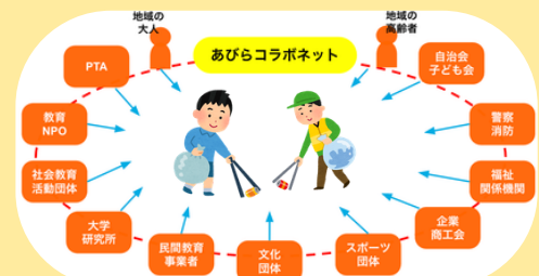
あびらコラボネット