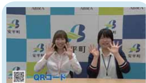
8 月 1 日から安平町職員が LINE@ を紹介する CM があびらチャンネルで放送中です♪