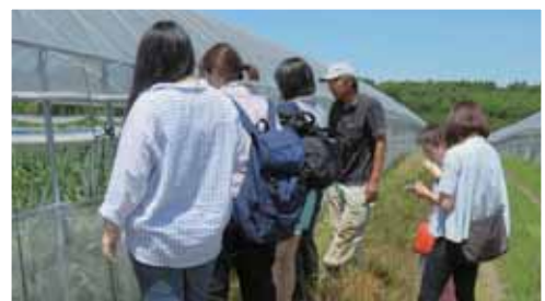
メロンハウスを見学する学生グループ