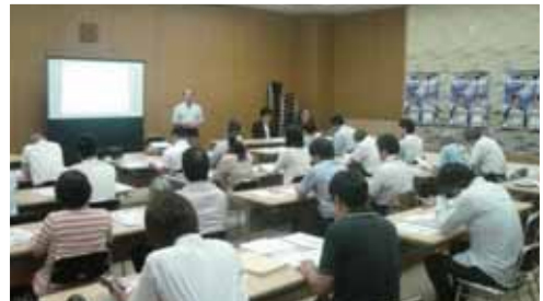
知的財産研修会の様子

参加者からは、類似商品との競合を避けるための留意点や商標登録を取得する際の経費負担などについて活発な質問があり、充実した研修会になりました。