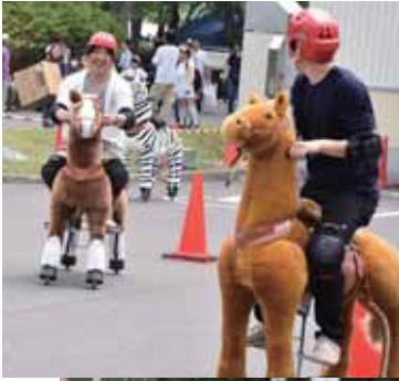
こちら名物「ポニー サイクル GP」！ 熱戦が繰り広げられ ました♪