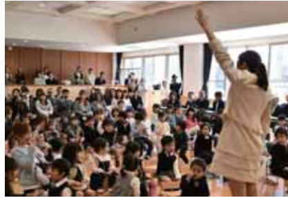
初めて行われた入園式！ おいわけ子ども園：72名