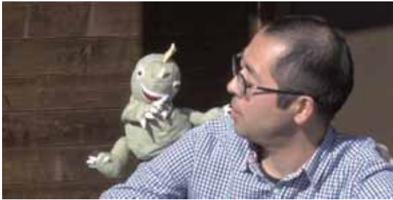
突然まっしーの前に現れたアピラン。 さあ、冒険の旅にレッツゴ～！

◆地域おこし協力隊まっしー をお楽しみに！ アピランの成長と活躍 は何を学ぶのか？ 怪獣になりたいアピラン。さて、今回の冒険では何を学ぶのか？ て、将来は「でっかい」 景色のすべてが新鮮！ 子ども怪獣のアピラン 山菜を採りに行きます。 会った町民の方に案内されて、春の息吹を感じる 第1回では、偶然出会った町民の方に案内されて、春の息吹を感じる山菜を採りに行きます。