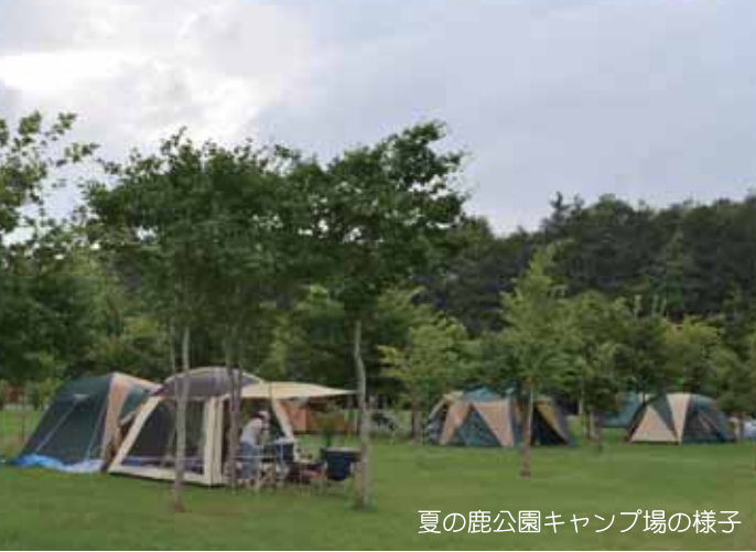
夏の鹿公園キャンプ場の様子

広々としたテントサイトはもちろん、バンガローやツリーハウスは人気が高く、それらを求め町外からのキャンパーも多く見られます。