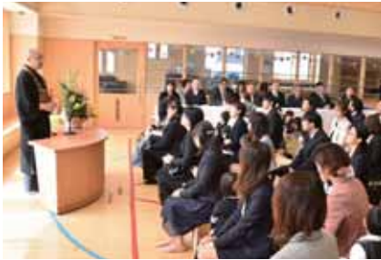
はやきた子ども園：55名