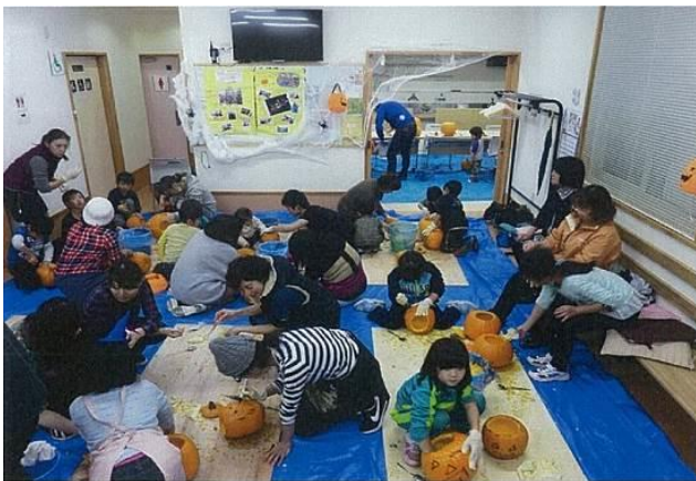
↑ ランタン製作状況