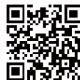
「Smile ☆ Cheerful」 Instagramアカウント

このような取り組みを通じて、スポーツ・文化活動を推進しています。持続可能なスポーツ・文化環境をつくるため、日々挑戦を続けていますので、引き続きご支援とご協力をよろしくお願いします。令和8年度も引き続き、あびスポッチャーをよろしくお願いします。