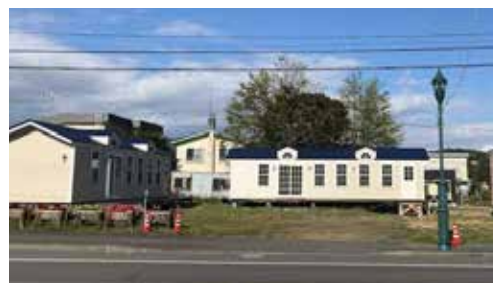
チャレンジショップ外観