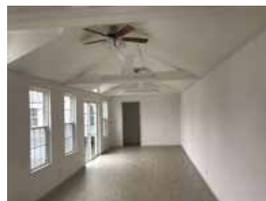
チャレンジショップ内観