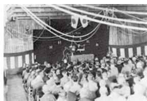
安平村開村50年記念式典

戦後の混乱期からようやく平静を取り戻そうとする同年九月二十日、安平村開村五〇年記念式典が盛大に挙行されるとともに、村内各地で祝賀行事が繰り広げられ、この日ばかりは戦後の不況や不安も忘れ、村を挙げて喜びに沸いた。