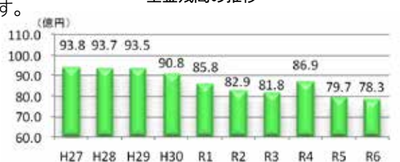
地方債残高の推移