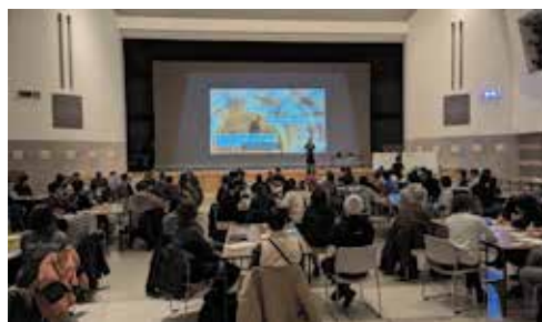
町内外合わせて約100名が参加しました