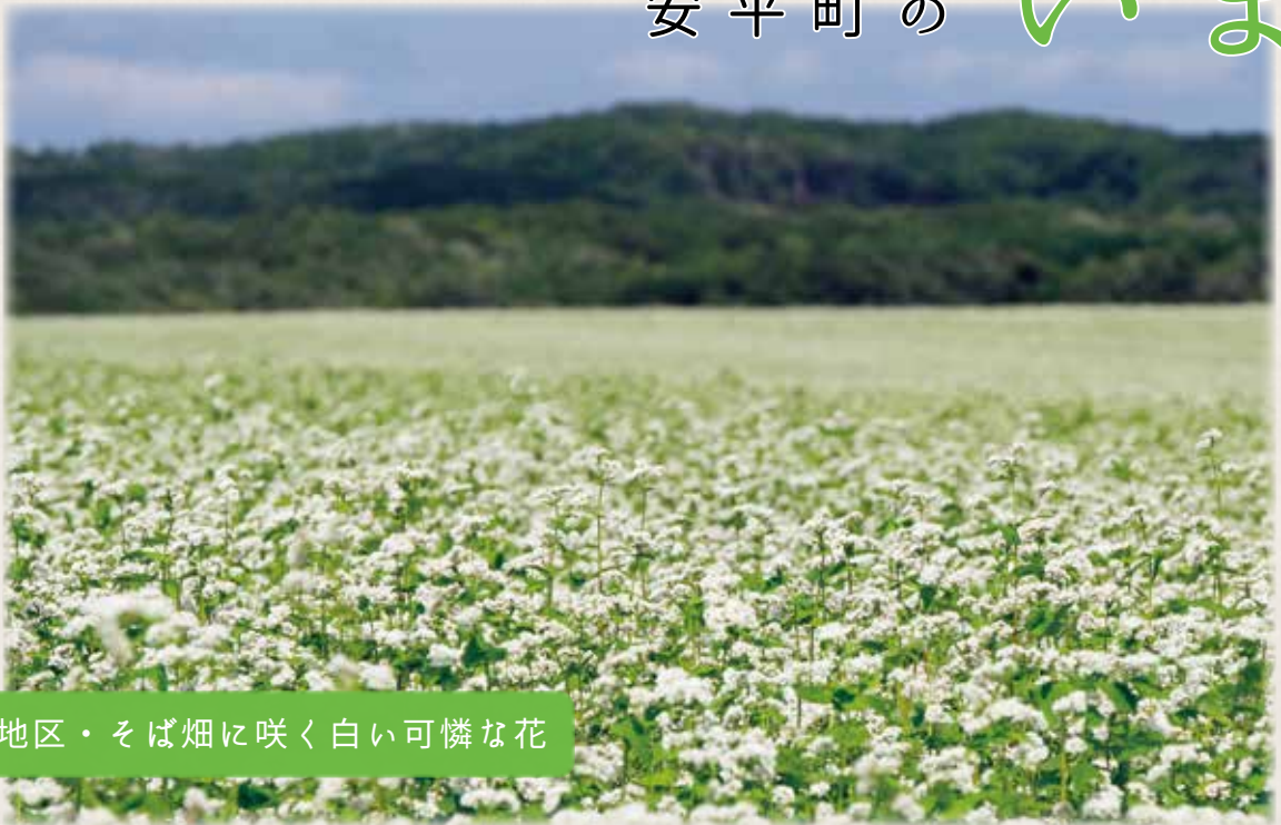
早来地区・そば畑に咲く白い可憐な花