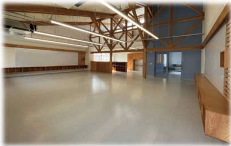
各ホーム (1〜9年生教室)