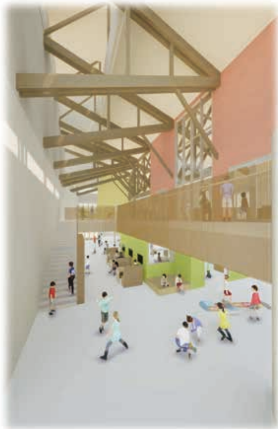
光のプロムナード

1〜6ホーム(1〜6年生教室)はこれまでの教室の約1.5倍の広さになります。全員で、グループで、友達同士で、自由なレイアウトで授業をすることができま。また、ホームの壁には黒板ではなくホワイトボードがついており、そこに映像を映しながら授業することも可能です。