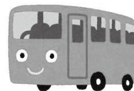
マルチタスク車両