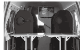
マルチタスク車両