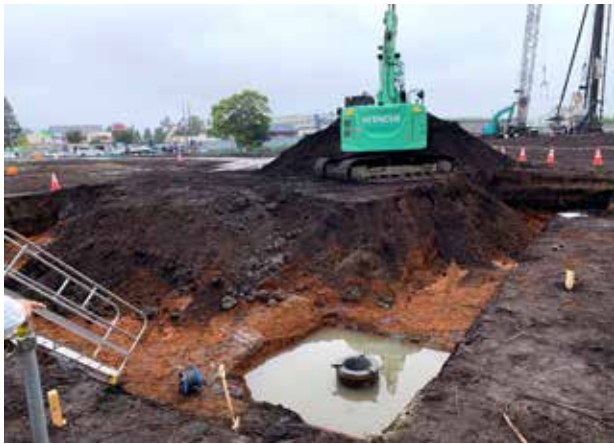
写真1 8月24日の掘削作業の様子

工事の様子は、写真3および4のような建設状況が伝わる写真を町ホームページで週に1回を目安に更新しています。インターネット環境がない方は、ご連絡ください。印刷し、お送りします。