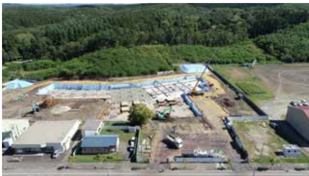
写真4 9月14日の建設現場の様子