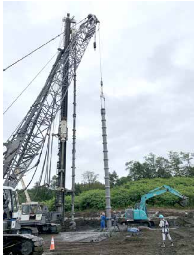
写真2 8月26日の杭工事の様子