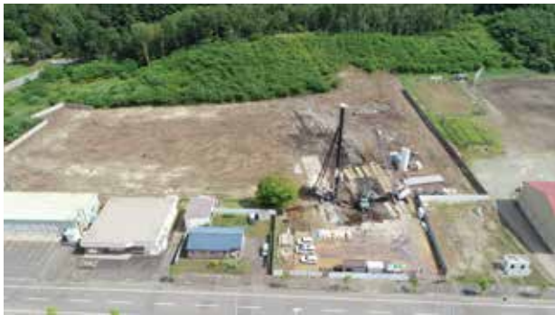
写真3 8月12日の建設現場の様子