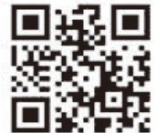
リネットジャパンリサイクル(株) QRコード

※FAXによる申込みをご希望の方は、町のホームページからダウンロード、又は税務住民課住民生活グループまでお問い合わせください。