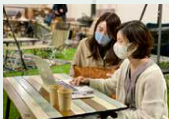
フリースペースは、 様々な用途でご利用できます。

2021年に入り心機一転。内装を大きく変更！床に人工芝を敷き、フリースペースとキャンプ用品を組み合わせた空間を創りました。芝の上は、靴を脱いでゆったりと過ごすことができるので、足を伸ばしてのんびりすることも。フリースペースなので、くつろぐだけでなく、食事や仕事などにご利用いただいてもOKです。