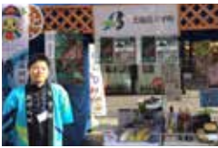
「例年、道内外のイベントで特産品を販売するブース等を行っていますが中止となり、町をPRする機会が減少しました」

新型コロナウイルス感染症の感染拡大により、例年2日間ですら人も来場者が訪れる町最大のイベント「うまかまつり」が中