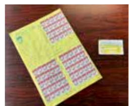
満貼のすずらんシール台紙、ハートスタンプカードは1枚500円のお金券として3月末まで参加店で使用可能。使用期限が迫っているため、早めの利用をお願いします。

6月1日(火)から始まる新しいポイント制度では、その2つを統合し、両地区共通でポイントの付与や利用が可能となり、より便利に。300円で1ポイント付与となり、ポイントカードはスマート