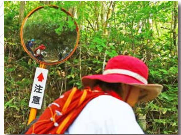
木漏れ日が気持ち良い。 そんな山の中を行く。