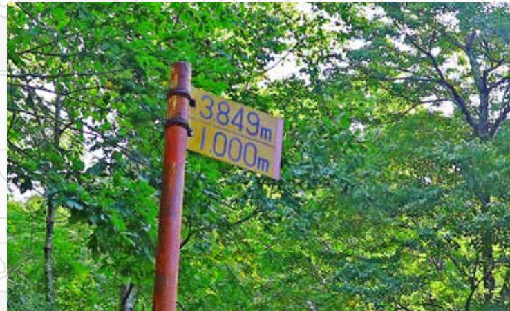
残り距離は4km弱。 「意外と距離あるね…。」 そんな声も聞こえてきた。