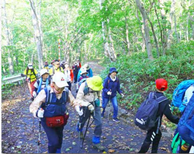
登山道の脇に流れる 川のせせりぎに癒されながら そして、 談笑しながらてくてく歩く。