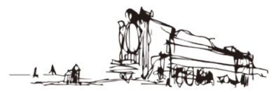
ABIRA D51 STATION D51ステーション