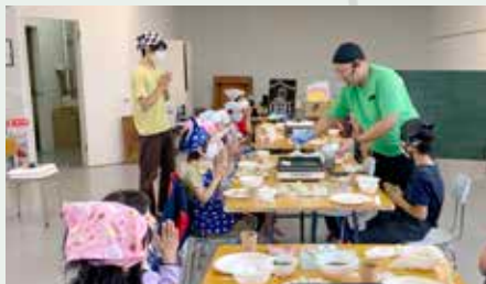
遊育事業で行った「餃子作り体験」の様子

遊育事業で行った「餃子作り体験」の様子 を作っている姿がとても印象的でした。子どもたちにとっては「異学年との交流」と「初めて餃子を一から作る経験」に新たな学びを得たイベントだったのではないかと思います。