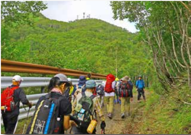
山頂にある NTT 無線中継所が 徐々に大きく見えるようになってきた。