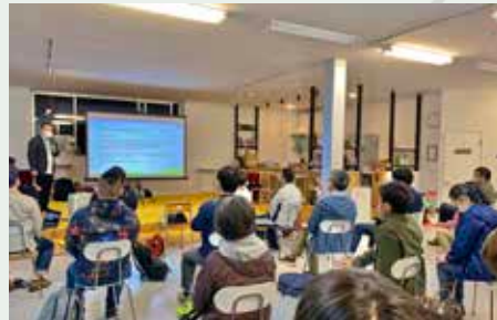
カイトク事業で行った「ABIRA TALKS」の様子