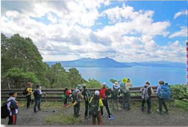
支笏湖越しの樽前山や風不死岳にカメラを 向ける参加者たち！ 目指すは頂上！あと少しだあ！