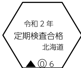
定期検査済証印 (北海道の例)