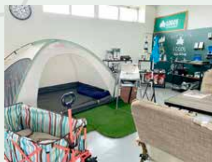
フリースペースはまるで テントサイトかと思わせるほどの充実っぷり

また、復興ボラセンはアウトドアブランドの正規代理店としての機能も有しているんです！アウトドアシーズン真っ只中ということで、フリースペース内に多数アイテムを用意しています。町内にも複数のキャンプ場があるので、このENTRANCEからもアウトドア・キャンプの盛り上げに寄与していければ良いなと思っています！今後は、アウトドア関連のイベント開催も予定しています。これから、どんどんワクワクする空間になっていくことでしょう♪お楽しみに！