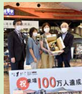
セレモニーの様子

2019年4月19日にオープンした『道の駅 D51あびらステーション』。7月3日(金)、来場者が100万人を突破し、記念セレモニーが行われました。100万人目となったのは、初めて安平町に来たという札幌在住の2人組。記念品として『アサヒメロン』など名産品の詰め合わせが町長より贈られました。「道の駅にはどんなものがあるのかなと立ち寄りました。びっくりしましたが、とてもラッキーでした」と記念品を手に笑顔！ 年間32万人の来場者を見込んでいましたが、当初の予定より3倍を上回る速度での達成となりました。