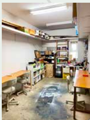
ENTRANCE に新しくできた オフィス兼会議室