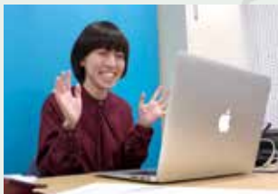
オンライン説明会時の様子

5月の中旬に2回、「おうち de あびらぼ」のオンライン説明会が開催され、町内の小学4～6年生が11名、中学1～3年生が10名の計21名の子どもたちが今年度のあびらぼに入会しました(途中でも随時受付中)。