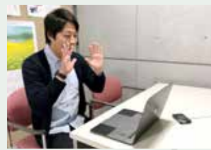
オンライン説明会時の様子②

あびらぼのメインの授業スタイルは、「探究授業」と言われる「一つテーマを絞ってそのテーマについて深く掘り下げていく」というもの。事前の説明で使われていた紹介動画では、「ピカソ」について掘り下げていました。ピカソの絵は、描かれた年代によって、絵の雰囲気非常に大きく異なっています。なぜ雰囲気の異なる絵が描かれたのか。ピカソがどんな心の変化があって、現在世に出回っているような抽象的な絵を描くことになったのか。これについて生徒みんな考えていくということを行っていました。また、実際のプログラムではこの探究授業に加え、「スキル編」という、生徒が探究授業に興味を持った「やりたいことを実現させるために必要なスキルを