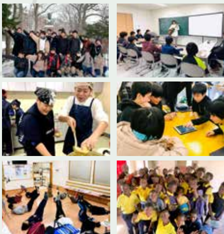
あびらぼの授業風景

オンラインを活用して始まった「おうち de あびらぼ」ではどんな新しい体験ができるのか。未だ未知数ではありますが、面白い経験を積むことができることは間違いありません。安平町の新しい学びの取り組みにこれから注目していきましょう!