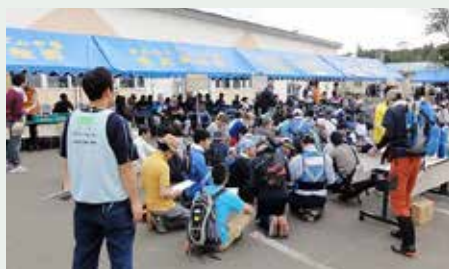
発災当時、全国から駆けつけたボランティア

今月の「未来へつなぐ」では、復興ボランティアセンターのこれまでの歩みをご紹介します。