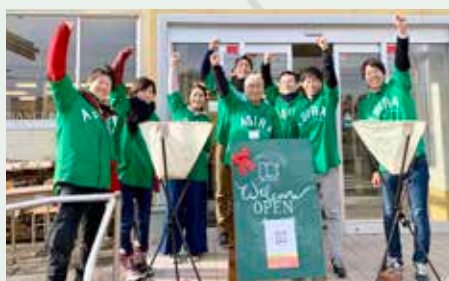
2019年11月 ENTRANCE が追分駅前にオープン！

2019年11月には「集まる」「話し合う」「創り出す」の3つのコンセプトを持つコミュニティスペース「ENTRANCE」をJR追分駅前にオープン。平日は「フリースペース」として地域のママ