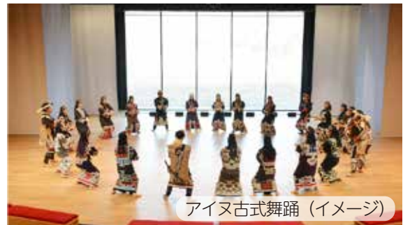
アイヌ古式舞踊（イメージ）