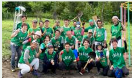
町を盛り上げるため、立ち上がった復興ボラセン

2018年11月、町民、行政、ボランティアを繋ぎ、復旧から復興へと町を盛り上げていく団体「安平町復興ボランティアセンター」が設立されました。「町に人が出歩かなくなり寂しい、町に元気と明るさを戻したい。」という声から始まった「ハシゴ酒シリーズ」は1年で6回も開催するほどの人気イベントに。