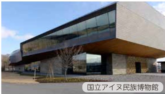
国立アイヌ民族博物館

古くからアイヌ民族のコタン（集落）があったことで知られる北海道白老町。その白老町ポロト湖のほとりに『ウポポイ（民族共生象徴空間）』が誕生します。愛称のウポポイは「(おおぜいで) 歌うこと」を意味するアイヌ語に由来し、「国立アイヌ民族博物館」や「国立民族共生公園」、「慰霊施設」が整備されます。