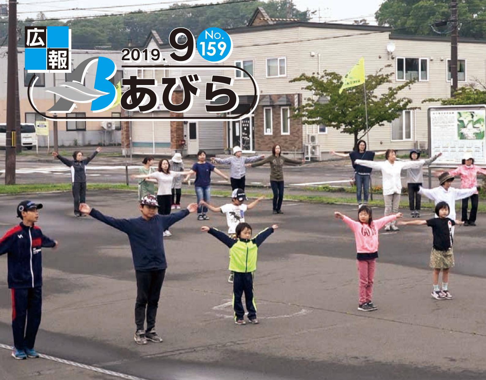
表紙 町民ラジオ体操会での一コマ (7月27日ふれあいセンターい・ぶ・き)