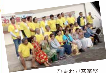
ひまわり音楽祭 (8月25日)