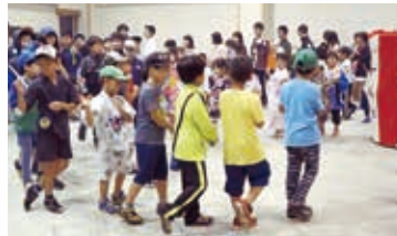
安平・おいわけ盆踊り (8月20日)