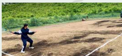
整備されたグラウンドで早速練習！

7月14日(日)、早来小学校のテニスコートの修復作業を早中テニス部員、保護者、ボランティア、復興ボラセンメンバーの計26名で行いました。この場所を「テニスコート」として使うのは“30年ぶり”。駆けつけた先生も感慨深そうにしていました。作業を手伝ってくれたテニス部員の子たちは「使えるようになって嬉しい、これからは自分たちでしっかり管理して