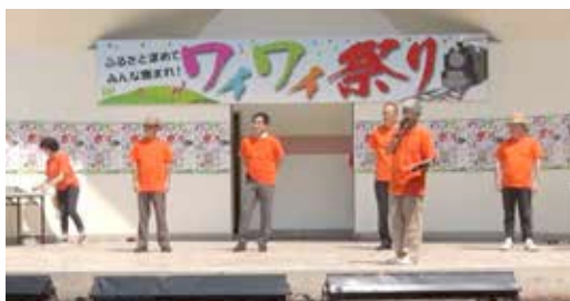
みんな集まれ！ワイワイ祭り (8月3日)