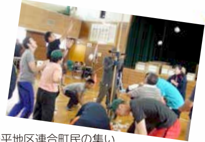
安平地区連合町民の集い (8月25日)