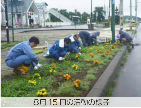
8月15日の活動の様子

8月15日に草取り等の美化活動を行いました。当日は小雨に見舞われる中、ビューティーサポートR234実施団体及びサポート隊の皆様、計16名の方々の協力をいただきました。誠にありがとうございました。ございました。