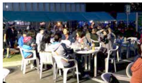
遠浅グリーンフェスティバル (8月24日)