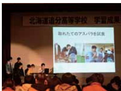
日常の学習成果をプレゼン中！