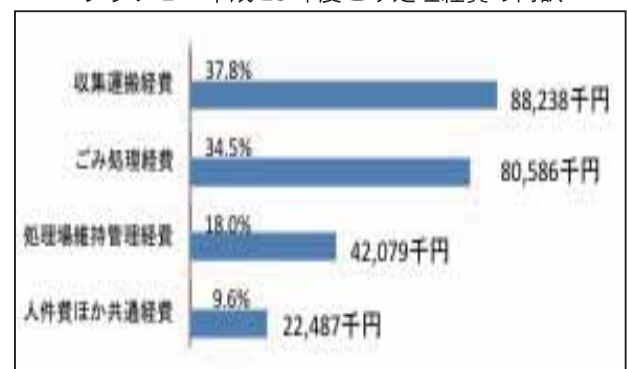
グラフ 2 平成 28 年度ごみ処理経費の内訳

ごみの収集運搬経費、ごみの焼却・埋立・資源化などを行うごみ処理経費、組合の処理場の維持管理経費及び人件費等が直接ごみ処理に要した経費で、ごみ 1 トンあたり約 64 千円、住民一人あたりで計算すると、約 18 千円となります。