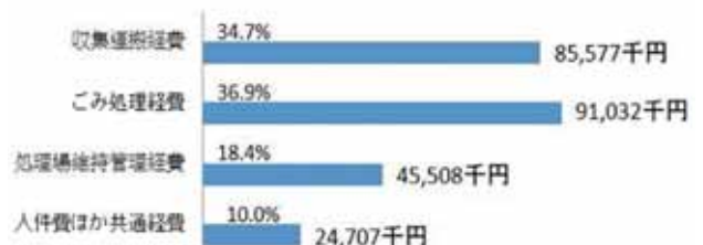
【グラフ2 平成25年度ごみ処理経費の内訳】

ごみの収集運搬経費、ごみの焼却・埋立・資源化などを行うごみ処理経費、組合の処理場の維持管理経費及び人件費等が直接ごみ処理に要した経費で、ごみ1トあたり約58千円、住民一人あたりで計算すると、約18千円となります。