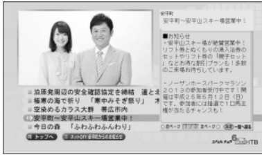
↑地域発トピックス画面