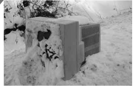
平成 25 年 1 月 道道千歳鷗川線 (厚真町内) パソコン投棄

上の写真のように、ステーション内の「ポイ捨て」や「家電リサイクル法対象品目や処理困難物をステーション等に出すこと」も不法投棄です。