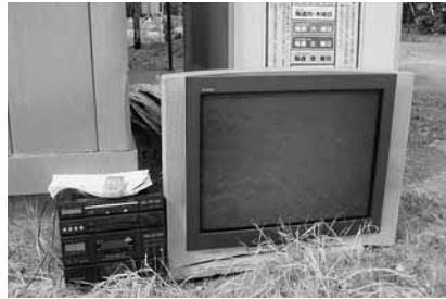
平成 24 年 7 月 安平町農家地区 ブラウン管テレビ等投棄