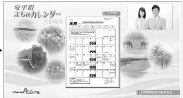
「まちのカレンダー」画面