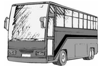
町循環バス利用人員 単位:人(延べ人員)

町循環バスの運行について ご意見ご要望は左記までご連絡下さい。 問合せ 総務課庁舎車両管理グループ ☎2511