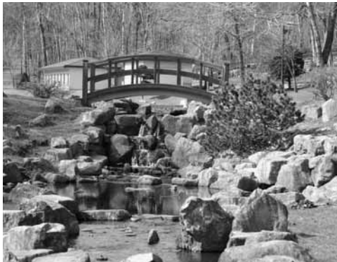
池の下流のせせらぎ広場

このように自然豊かな鹿公園は家族連れなど多くの方の憩いの場となっており、その中にキャンプ場が設けられ、週末や夏休みには多くの方が利用しています。