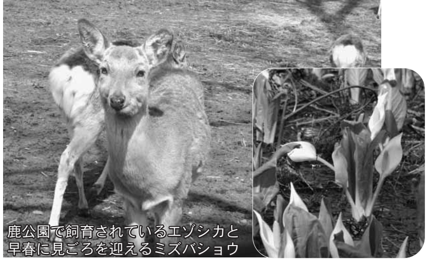
鹿公園で飼育されているエゾシカと早春に見ごろを迎えるミズバショウ