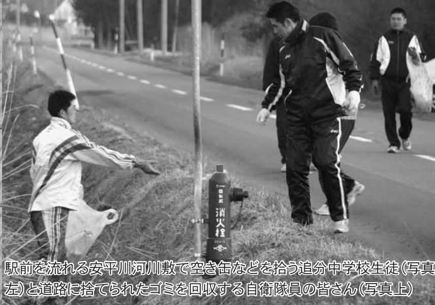
駅前を流れる安平川河川敷で空き缶などを拾う追分中学校生徒(写真左)と道路に捨てられたゴミを回収する自衛隊員の皆さん(写真上)