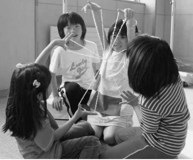
〔児童館で遊ぶ子ども達〕

「放課後児童クラブ」の利用については健康福祉課子育て支援係(☎⑤4555)、住民総合相談室(早来庁舎☎②2511)までお問い合わせください。