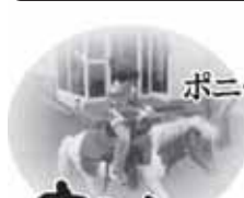
ポニーがいる整備工場