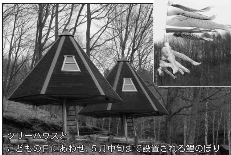
ツリーハウスと こどもの日にあわせ、5月中旬まで設置される鯉のぼり

トイレやバーベキューハウス、炊事場などの施設の充実はもちろん、アスレチックやすべり台が設けられ、遊びを体験することもできます。テントサイトは約1haで500