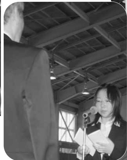
追分高等学校（4月9日）