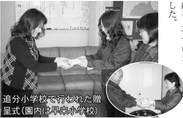
追分小学校で行われた贈呈式(園内は早来小学校)