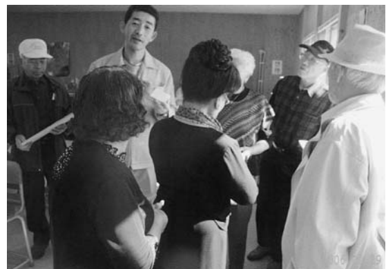
木彫りサークル視察風景 (平成18年度実施事業)