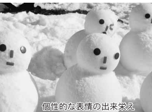
個性的な表情の出来栄