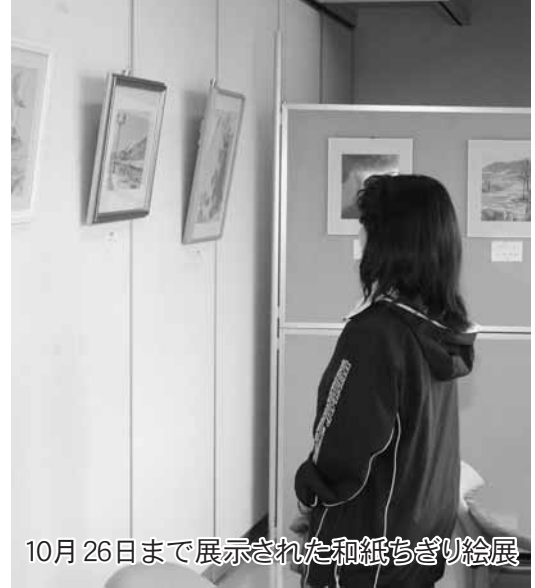
10月26日まで展示された和紙ちぎり絵展