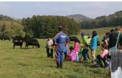
親子の牧場散策の様子 (10月上旬)

心や体を豊かにするポイントをおすそ分けしてくれる協力者、仲間ともしっかりと出会いたいです。安平町をより多くの人に好きになって貰えるよう活動していきますので、皆さんと一緒に盛り上げていきましょう!