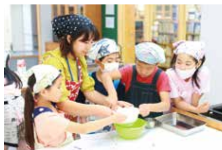
放課後こども教室