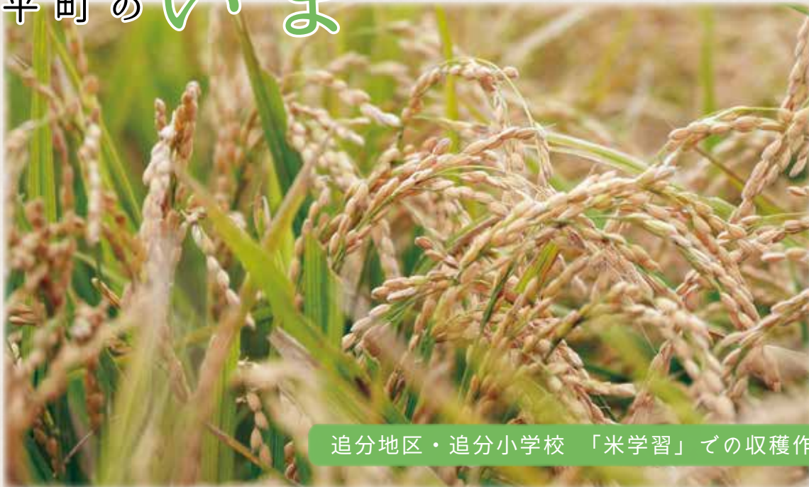
追分地区・追分小学校 「米学習」での収穫作業