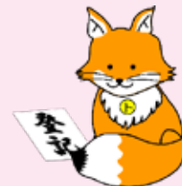
不動産登記推進イメージキャラクター「トウキツネ」