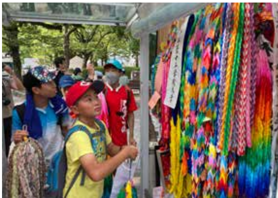
折り鶴奉納の様子

8月5日、広島県へ到着した派遣団は、町内の児童生徒（学校・児童館）、町民の皆さんが「平和への祈り」を込めて織り込んだ千羽鶴を「原爆の子の像」へ奉納した。千羽鶴を奉納したあとは「広島平和記念資料館」へ移動。