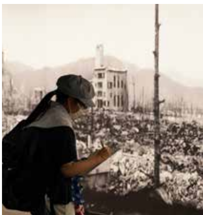
広島平和記念資料館での派遣団の様子