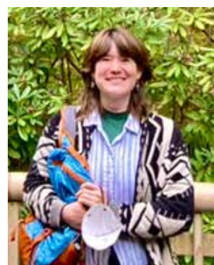
（昨年交流会の様子）