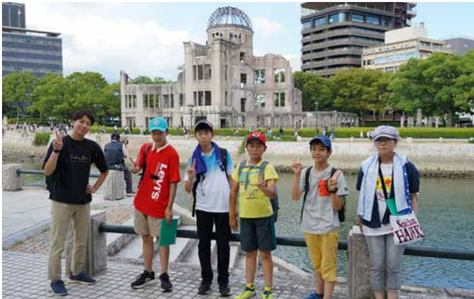
原爆ドームの前で撮影する派遣団