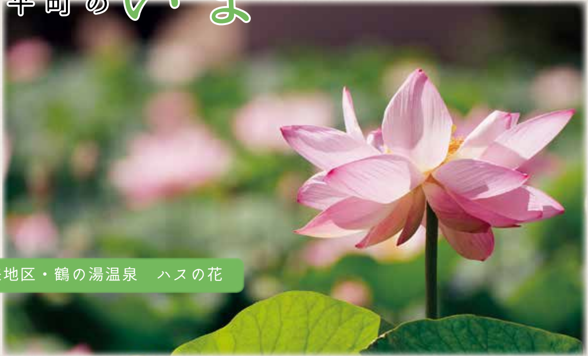
早来地区・鶴の湯温泉 ハスの花