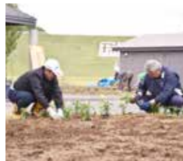
皆さん力を合わせ綺麗な花壇になりました

瑞穂ドリームカントリークラブ主催の瑞穂ダム春の植樹祭が行われました。当日は、地域住民や協賛企業など多くの方々に参加。多くの花で彩り豊かな花壇となりました。