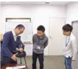
武田さん（地域おこし協力隊）の話を聞く追高生

追分高校の2年生2名が職場体験であびらチャンネルの制作実施。機材の取り扱いや編集で頭を悩ませる場面も。それでも職員らのアドバイスをもとに、映像制作を行いました。