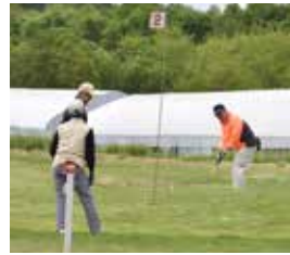
緑に囲まれたコースで皆さん楽しそうにプレー

町民パークゴルフ大会が佐藤農園パークゴルフコースで行われました。参加者は楽しそうにプレー。天候に恵まれ、気分の良いラウンドになったのではないのでしょうか。