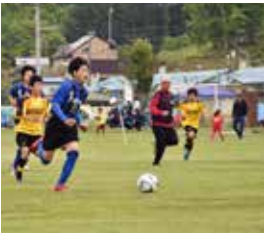
多くのゴールシーンを見ることが出来ました

はだしの広場で、第7回はいチーズーニコニコカップが開催。大会は3つの世代に分けて行われ、14歳以下のカテゴリーでは、フェリーレFCが準優勝の好成績をおさめました。