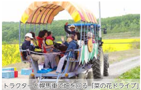
トラクターと幌馬車で畑を回る「菜の花ドライブ」

このように、今回のイベントでは、1つの目的をきっかけに複数箇所に立ち寄る来訪者の動向がうかがえました。来春、「あびら D51 ステーション」開業後は、道の駅が特産品や観光情報、各種催しの集結拠点となります。町の玄関口として、来訪者に新たな安平町の魅力を感じていただくとともに、町内ファンの獲得につなげることができるよう、今回の菜の花イベントの成果を参考に取り組みを進めていきたいと考えています。