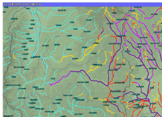
洪水警報の危険度分布