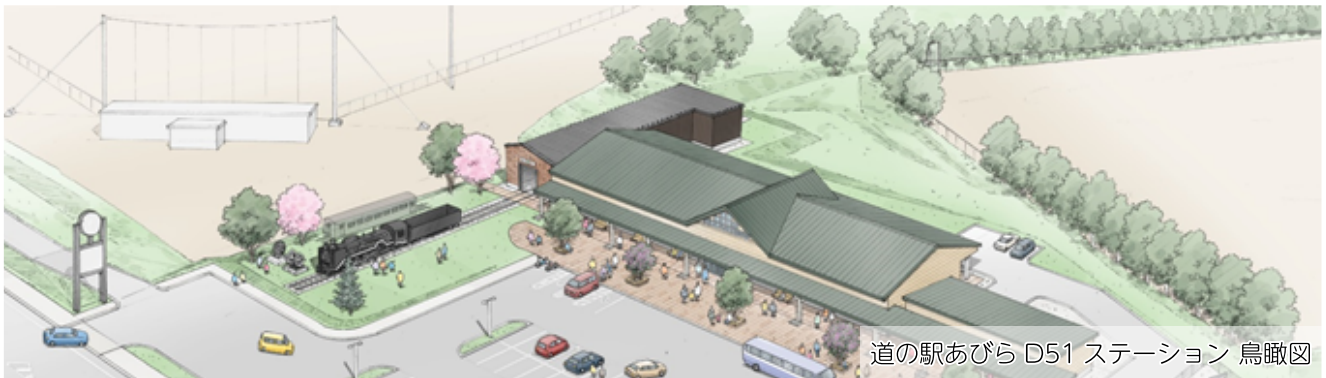
道の駅あびら D51 ステーション 鳥瞰図