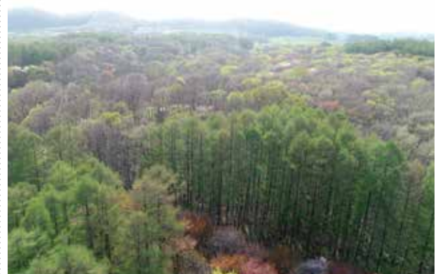
どこまでも続くかのような日本最古の保健保安林