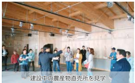
建設中の農産物直売所を見学

7月7日(土)～8日(日)は、「第10回あびら夏! うまかまつり」の会場内で、2日間にわたる野菜即売会を行いますので、みなさんぜひお立ち寄りください。