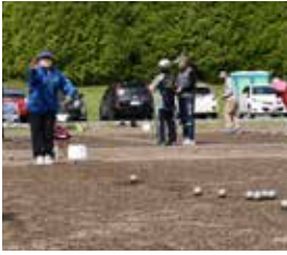
今年の大会も多くの方が参加されていました

第19回ホスピタリティペタンク安平選手権大会がときわ公園で開催。当日は北海道内各地からはもちろん、本州からの参加者も心地良い風が吹く中、真剣勝負が繰り広げられました。