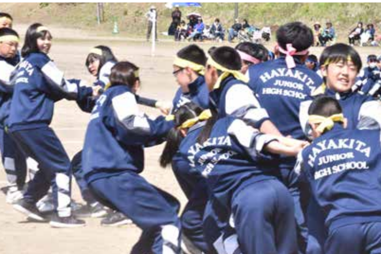
5月26日 早来中学校 追分中学校