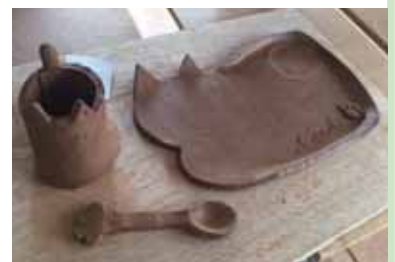
綺麗に焼けると良いな♪