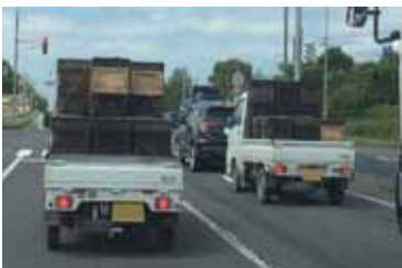
今年もこんな風景が町内で...