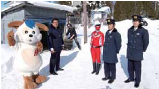
撮影に協力してくれた皆さんと一緒に！