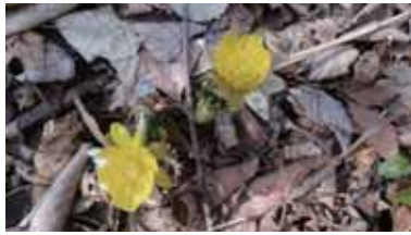
少しずつ春を見つけています!

道沿いには朽木にこれでもかとキツツキにつつかれた痕がありました。山頂に近づくとつれてポツポツと、リフトの降り場が福寿草の花畑になっていました。あちこちで芽吹きなど春を感じるとワクワクします。