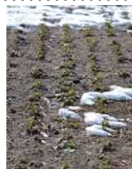
冬の頃、雪の下で画えていた菜の花たち

連作ができない菜の花は、毎年畑の場所が変わり、見える景色が変わるのも醍醐味♪今年も楽しみです。