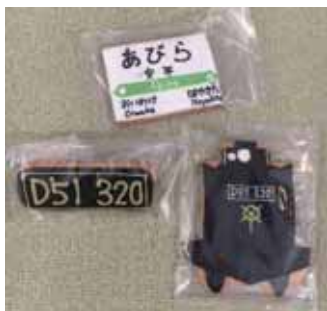
試作・提案された アイシングクッキー

2月22日には業務提携先の企業から焼いたクッキーの表面に砂糖・卵白を着色して装飾した“アイシングクッキー”の提案があり、道の駅の名称にちなんだ商品開発の可能性も検討しています。