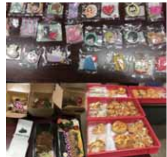
様々なものを試作中！

テイクアウト商品の開発では、同協会と業務提携した札幌市内で飲食店舗を運営する企業による「美と健康」をテーマとした地域食材を使った持ち運びできるメニューの試作が行われています。このほか、町内の商業と農業が連携した新たな特産品開発も同時に進められ、4月以降、各種イベントで試験販売する計画もあります。