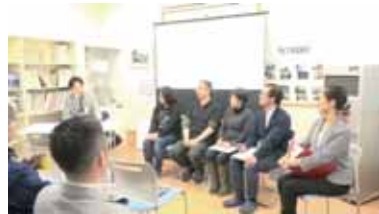
皆さんありがとうございました!