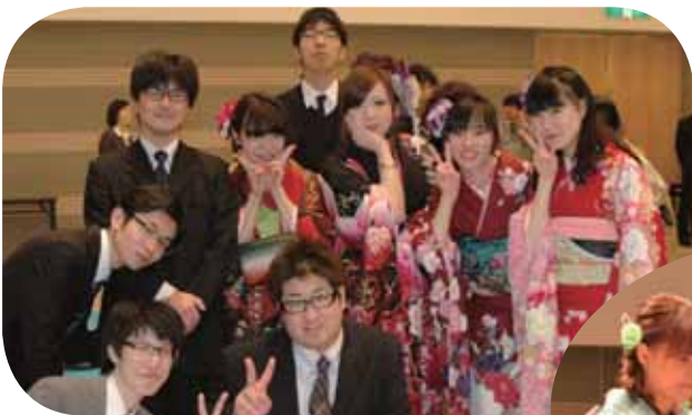
旧友との再会を記念に