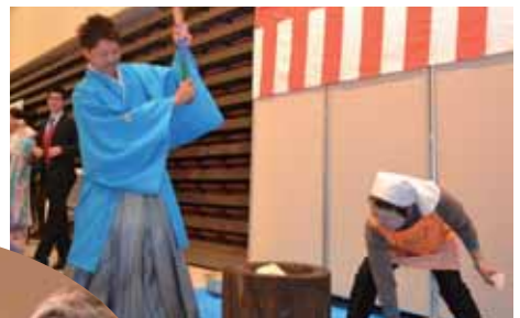
↑粘り強い大人に ←成人証の授与