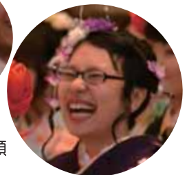
中学生当時のビデオ上映に笑顔